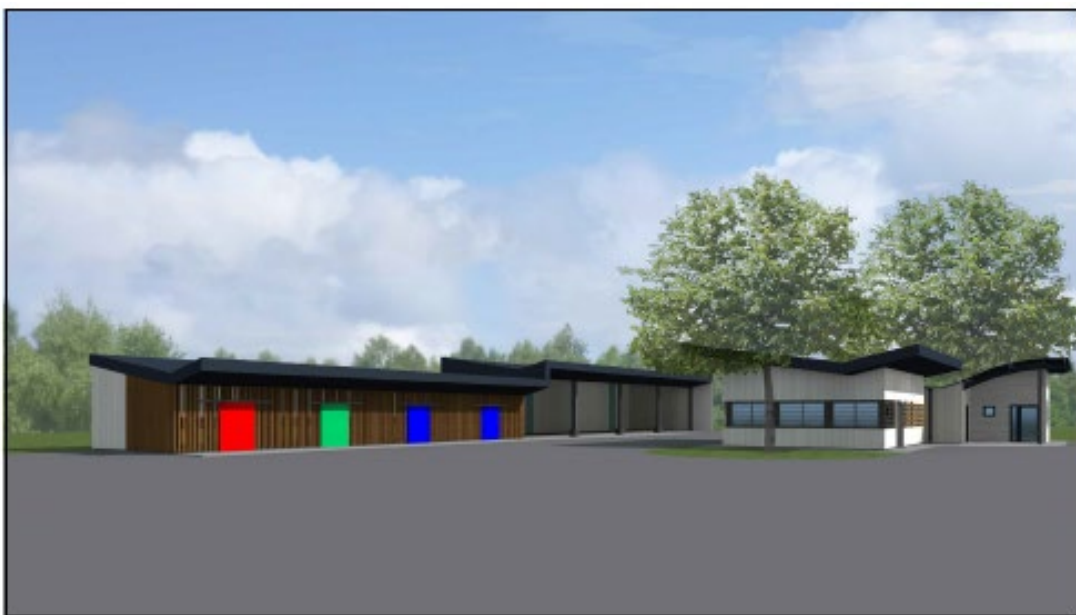
Future zone d'accueil avec bâtiment « Matériau-thèque »

Cette pratique qui permet également de réduire le tonnage des déchets est déjà en place sur le site de Châteaubernard, à Calitorama.