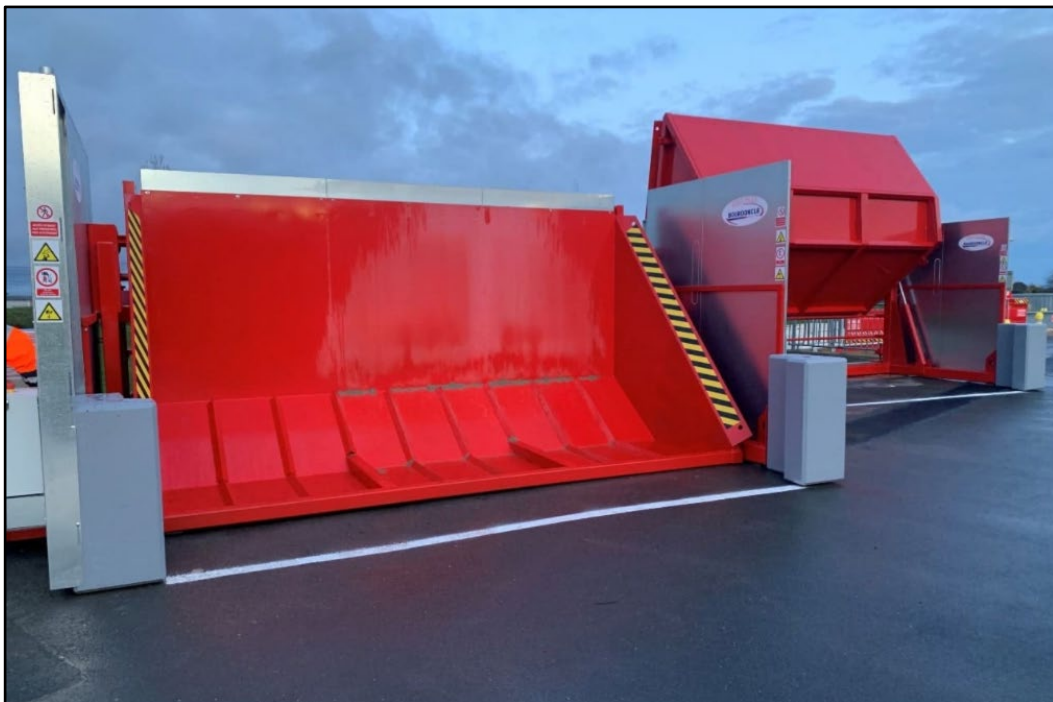
Dispositif de vidage automatisé permettant aux usagers de déposer leurs déchets au sol

La déchèterie de Barbezieux sera la première du département à être sécurisée par cette solution innovante.